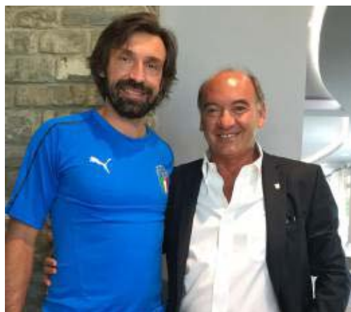
Andrea Pirlo con Walter Della Frera

per una vita dedicata a questo mondo fantastico. Il 2020 è stato un anno davvero difficile per me. Ancora una volta grazie alle bocce, al mio sport meraviglioso, che mi ha restituito il sorriso». «Non sono uno da premi, sto bene in barca con i ragazzi» ci dice Giancarlo Romagnoli, che come collaboratore della nazionale di canottaggio ha contribuito alla qualificazione di diverse imbarcazioni all'Olimpiade di Tokio spostata causa