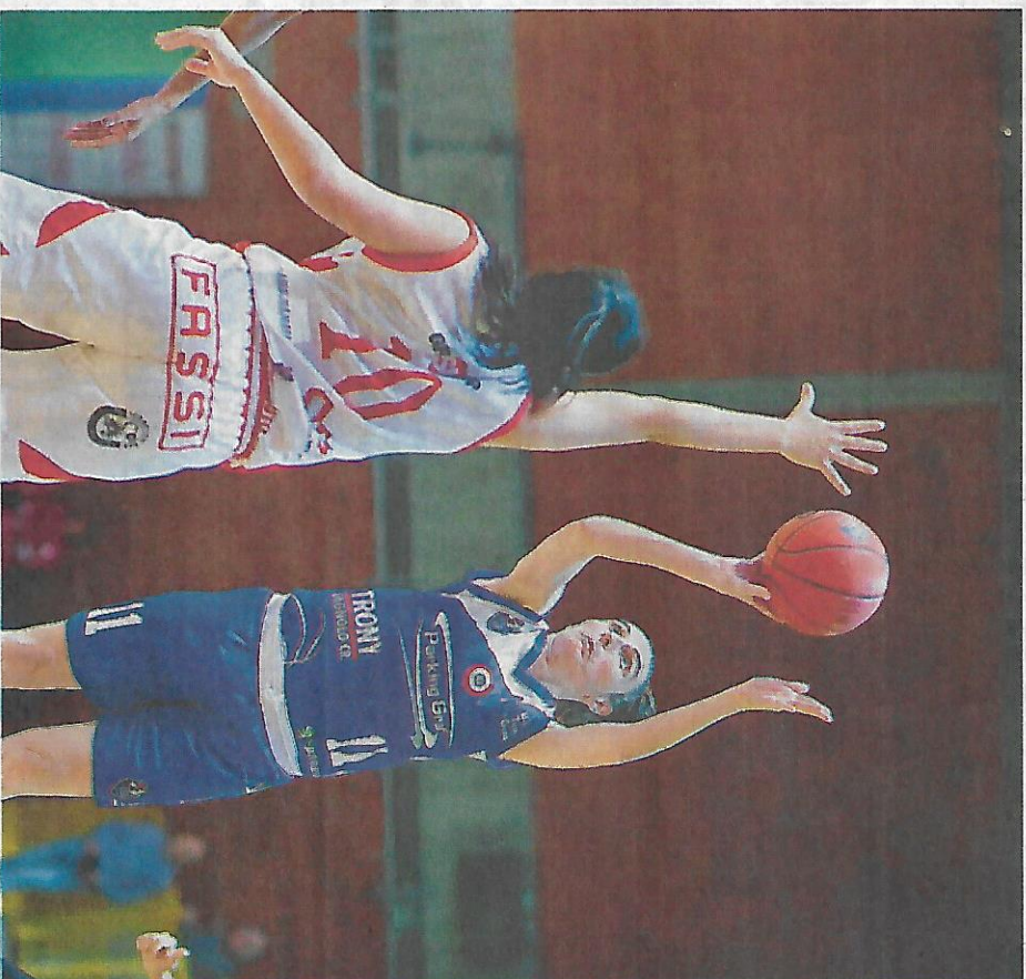
La biancoblu Cacciarianza al tiro; per le ragazze è arrivata una sconfitta con le veronesi

S i è fermata a 12 la striscia positiva della Parking Graf Crema, che sul campo dell'Alpo Villafanca è caduta per 60-51 lasciando in classifica Moncalieri in vetta solitaria, ma mantenendo comunque la seconda piazza per differenza canestri proprio contro le veronesi, forti del pit 12 dell'andata.